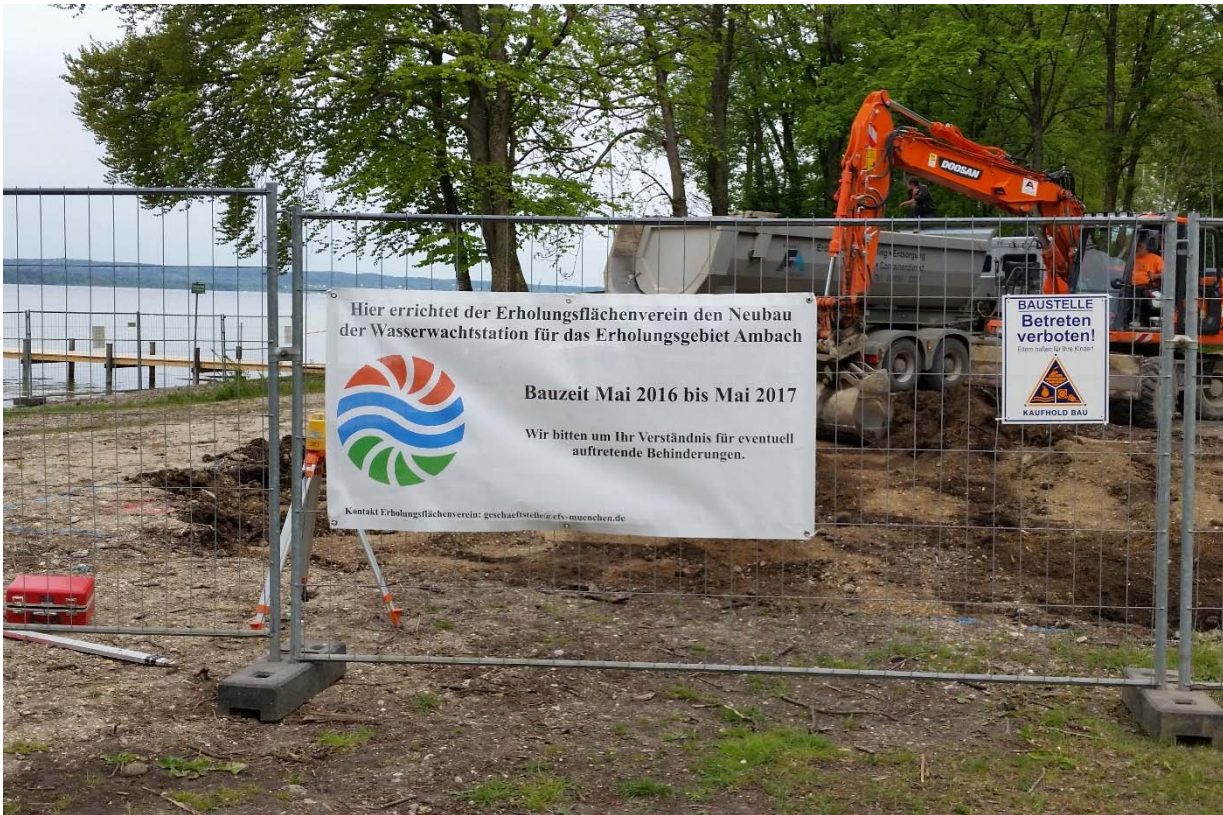
Wasserwachtstation Ambach, Baubeginn

Der im Mai 2016 begonnene Neubau der Wasserwachtstation in unserem Erholungsgebiet Ambach wird nach derzeitigem Stand sowohl zeitlich als auch kostenmäßig nach Plan erfolgen.