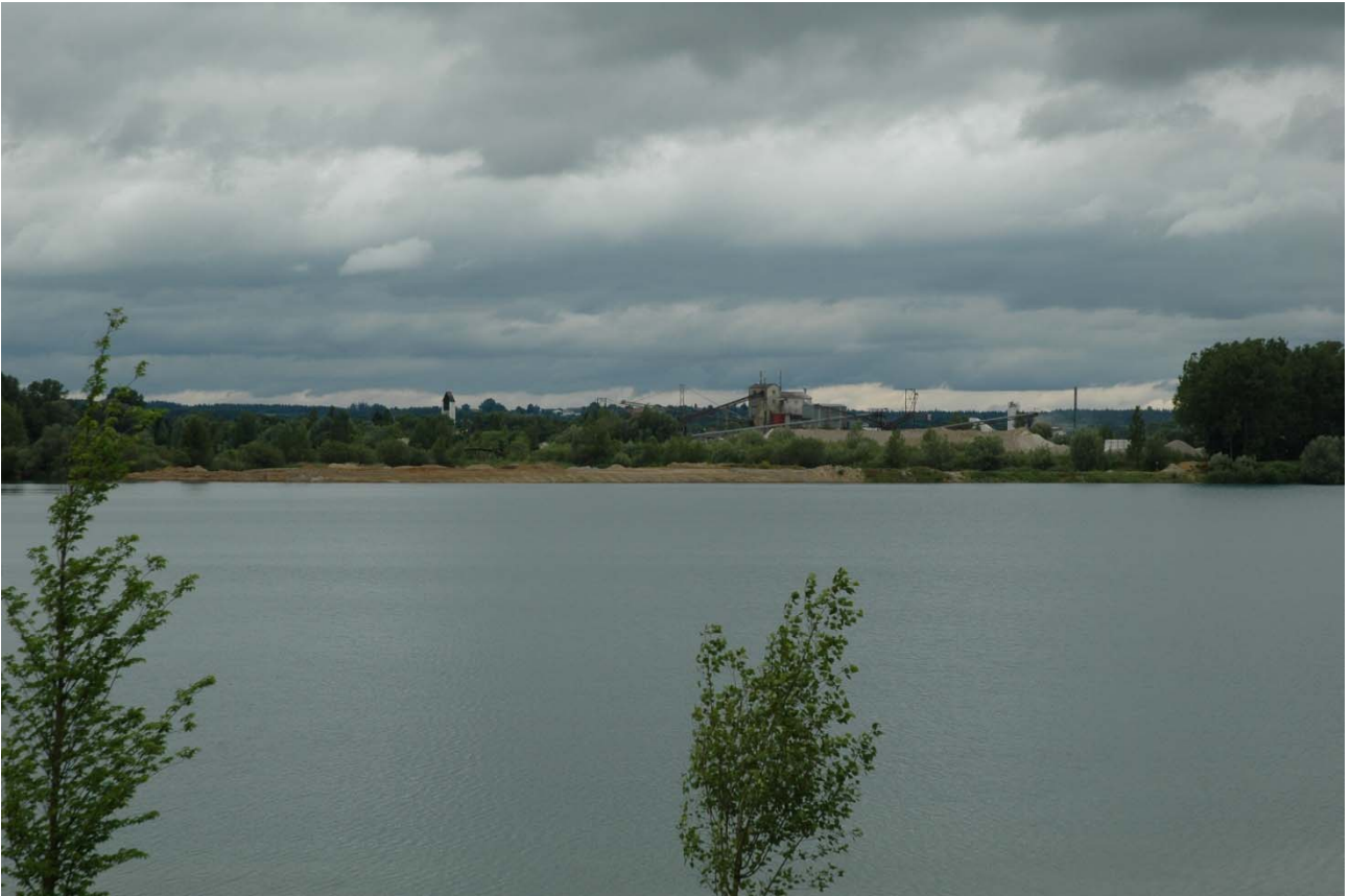
Pullinger Seen - Blick von Süden auf die Verfüllung im Mittelabschnitt

Die Verfüllarbeiten im Bereich des mittleren, bereits genehmigten dritten Bauabschnitts des Erholungsgebietes Pullinger Seen gehen wesentlich schneller voran, als bislang angenommen. Der bislang angenommene Realisierungshorizont 2025 kann sich bei dieser Entwicklung auch bedeutend verringern.