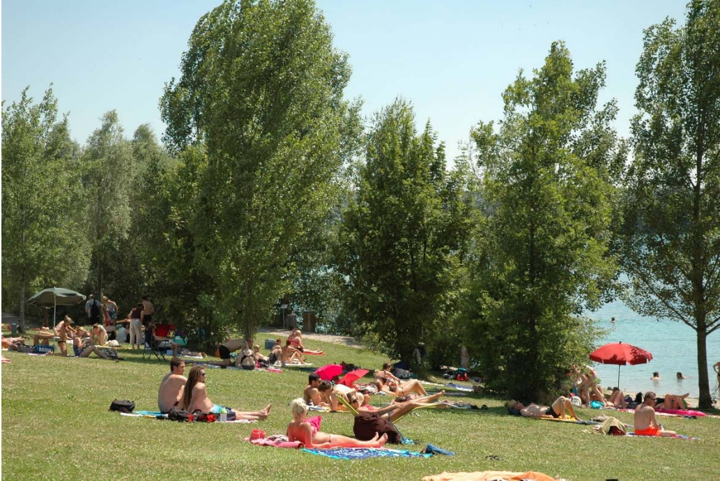
Pullinger Seen im Sommer

Im Bereich des Erholungsgebietes Pullinger Seen ist seit 2010 der erste und seit 2015 der zweite Bauabschnitt in Betrieb. Beide sind gut angenommen und hochfrequentiert.