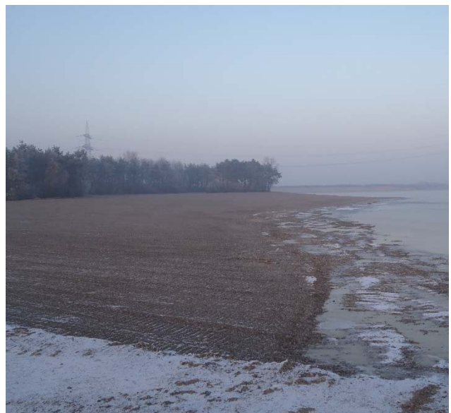
Neuer Strand im ehem. Bereich des Kieswerks

der Attraktivität des Geländes führen wird. Das von der Gemeinde Eching für die Flächen des sog. „dritten Bauabschnittes“ entlang des Nordufers, dem ehemals geplanten Thermenstandort, sowie für die Flächen der jetzigen Bodenbörse südöstlich des Sees angestrebte Gutachterverfahren hat begonnen. Eingeladen wurden drei Landschaftsarchitekturbüros, die im Januar 2017 die Ergebnisse ihrer Überlegungen vorgestellt haben.