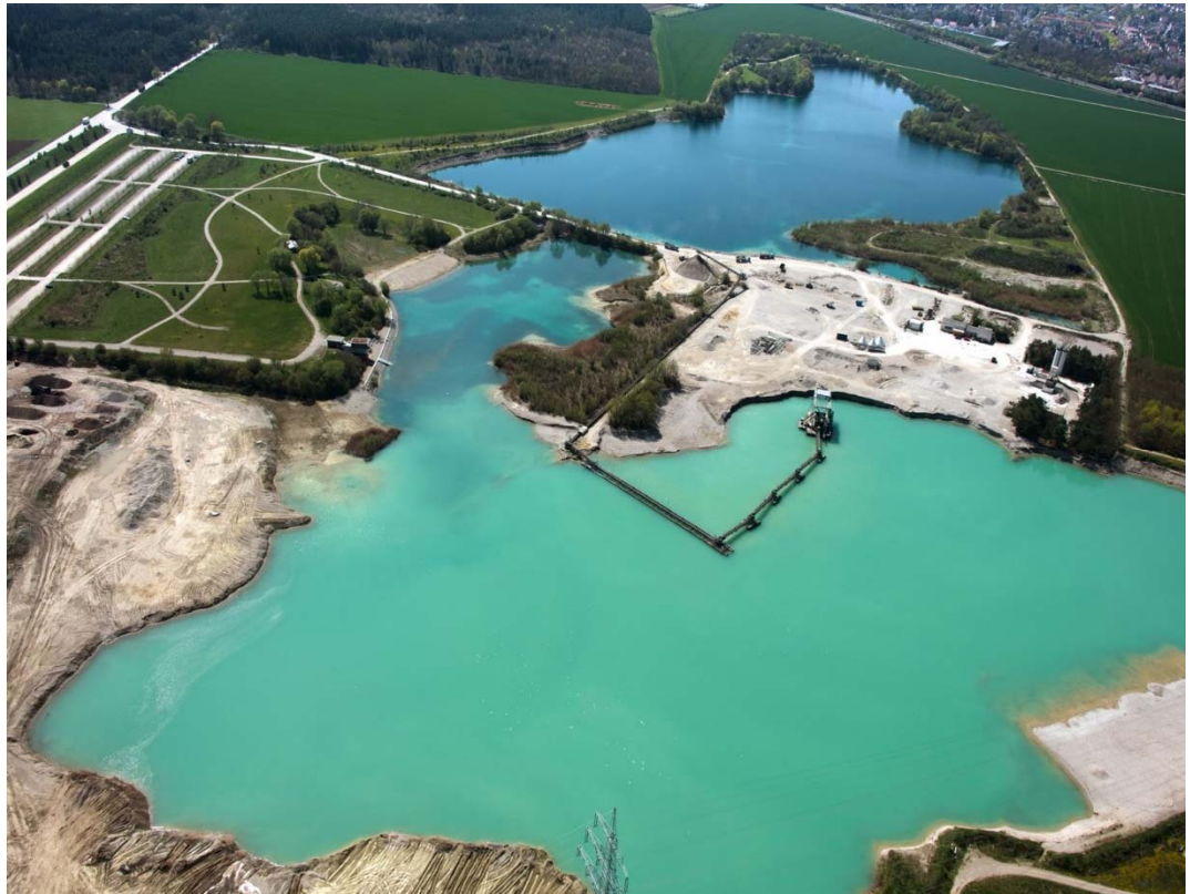
Hollerner See, Flächen 2. Bauabschnitt im Vordergrund, 1. Bauabschnitt links im Hintergrund

Am Hollerner See werden wir unseren Grunderwerb fortsetzen und die planerischen Voraussetzungen für den Beginn der endgültigen Herstellung des zweiten Bauabschnittes ab 2018 schaffen.