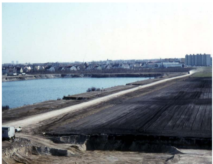
Karlsfelder See 1972