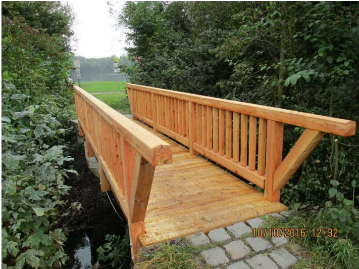
Unterschleißheimer See, Neubau Brücken