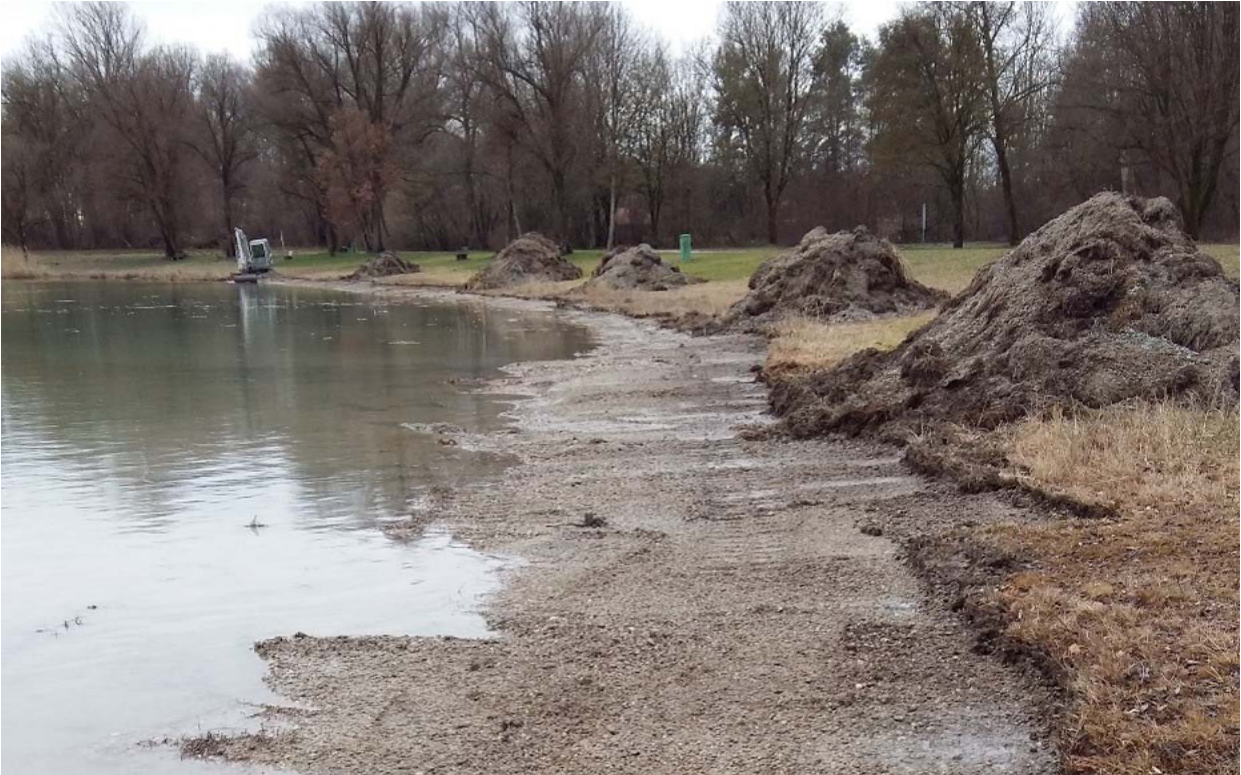
Kranzberger See, Wiederherstellung des Badeufers

Im Erholungsgebiet Kranzberger See wurden 2016 als weiterer Schritt der Sanierungsmaßnahmen weite Teile des direkten Uferbereichs von Sukzession befreit und wieder als Badeufer ausgestaltet.