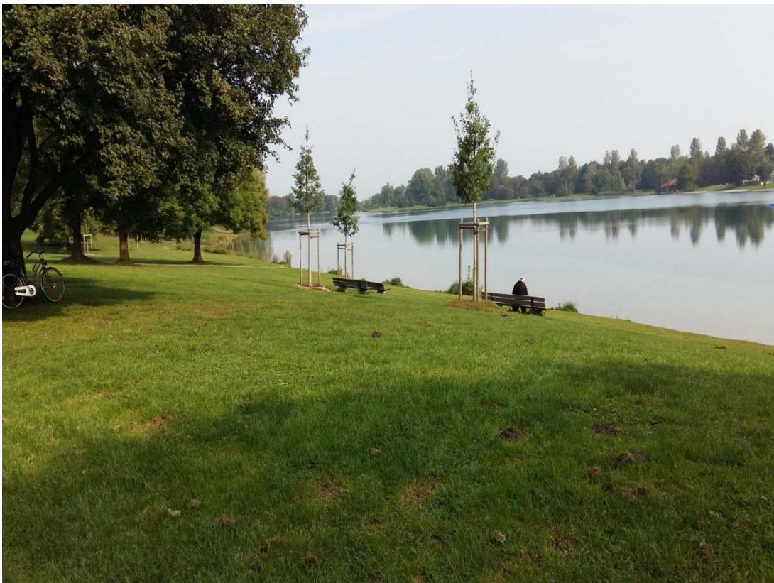
Karlsfelder See, Nachpflanzungen

Insgesamt 38 Laubbäume wurden im Bereich der Liegewiesen nachgepflanzt. Auch die vorhandenen Sommerstockbahnen sind im Rahmen dieses Bauabschnitts überarbeitet worden und erhielten neue Einfassungen sowie einen neuen Belag.