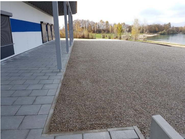
Kiosk Pulling II, Ausgabebereich, Biergarten

Die Errichtung des vom staatlichen Brauhaus Weihenstephan geplanten und finanzierten Kiosks hat sich bis zum Herbst 2016 erstreckt und somit mehr Zeit in Anspruch genommen, als ursprünglich vorgesehen.