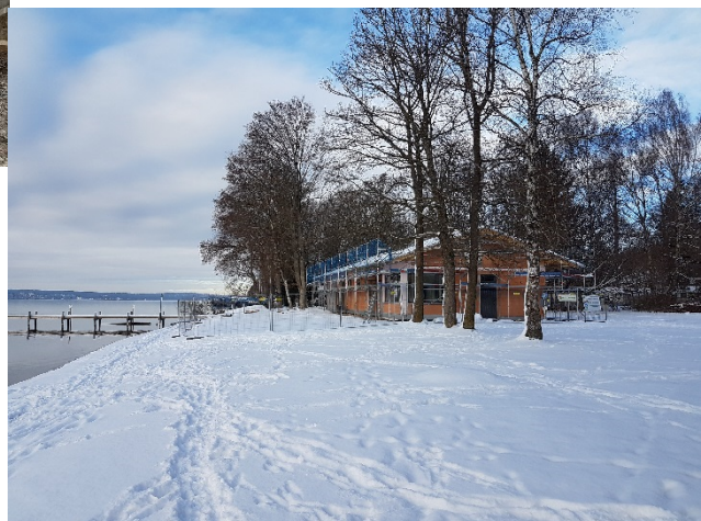
...und Winter 2016

Das Gebäude steht gegenwärtig im Rohbau einschließlich Bedachung, Türen und Fenster und wird bereits beheizt. Gegenwärtig erfolgt der Innenausbau. Sobald die Witterung es zulässt, folgen der Außenputz, die teilweise Holzverkleidung der Fassade und die Wiederherstellung der Außenanlagen.