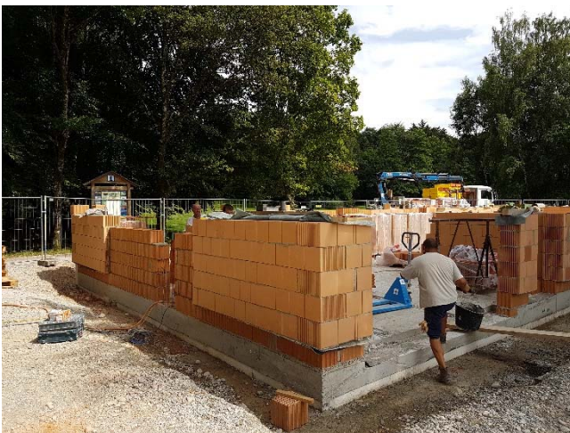
Wasserwachtstation Ambach im Bau im Sommer...

Das Gebäude steht gegenwärtig im Rohbau einschließlich Bedachung, Türen und Fenster und wird bereits beheizt. Gegenwärtig erfolgt der Innenausbau. Sobald die Witterung es zulässt, folgen der Außenputz, die teilweise Holzverkleidung der Fassade und die Wiederherstellung der Außenanlagen.