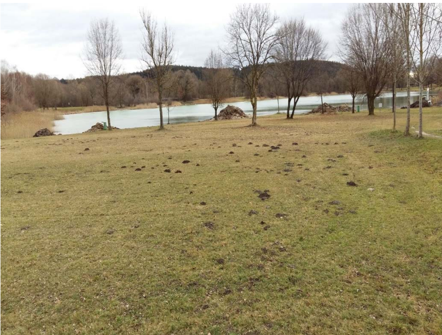
Kranzberger See, Blick von Norden

2017 sind Maßnahmen zur Erneuerung und Anpassung der Ausstattung des Geländes vorgesehen.