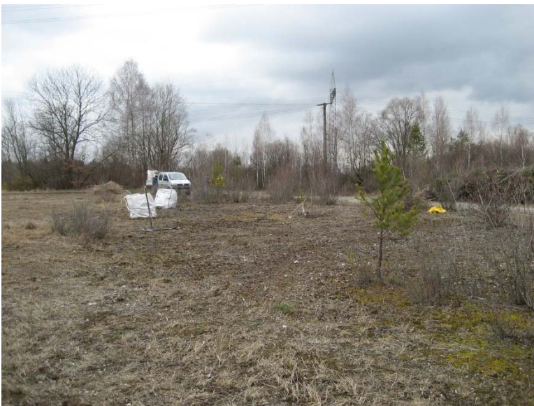
Pflegemaßnahmen am Böhmerweiher

Um zu verhindern, daß in der Zeit der Planungen und des Genehmigungsverfahrens die wertvollen Biotopstrukturen Schaden nehmen, hat sich der Erholungsflächenverein mit dem Bund Naturschutz und dem Landesbund für Vogelschutz über laufende Pflegemaßnahmen in den sensiblen Bereichen verständigt. Die erforderlichen Arbeiten werden nun kontinuierlich von Fachpersonal für Biotoppflege des Landesbundes durchgeführt. Die anfallenden Kosten trägt der Erholungsflächenverein.